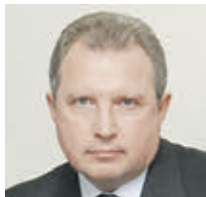
АЛЕКСЕЙ ХРИПУН МИНИСТР ПРАВИТЕЛЬСТВА МОСКВЫ, РУКОВОДИТЕЛЬ ДЕПАРТАМЕНТА ЗДРАВООХРАНЕНИЯ ГОРОДА МОСКВЫ

в апреле следующего года, а в эксплуатацию сдадут в 2021-м. В течение трех лет, включая 2023 год, будет отремонтировано 135 зданий. Это почти треть всех поликлинических зданий в Москве. В поликлиниках мы внедрим единый стандарт набора специалистов. В каждом медучреждении будут работать врачи по восьми самым востребованным направлениям. В связи с этим помещения будут перепланированы. Так, на первом этаже каждой поликлиники расположатся более востребованные специалисты. Там же будут находиться лаборатории. Важный момент модернизации поликлиник — это замена аналогового оборудования на цифровое. Новая техника будет работать намного эффективнее и давать более точные результаты. Также усовершенствуем кабинеты врачей, модернизируем и пространство для пациентов. В холлах будут обустроены открытые пространства с удобными диванами. Еще мы планируем сделать игровую зону для детей, чтобы они во время ожидания приема врача не скучали. Помимо этого, в новых поликлиниках появятся буфеты, в которых посетители смогут подкрепиться. Отмечу, что эту работу мы делаем совместно с Департаментом капитального ремонта города Москвы. Департамент здравоохранения разрабатывает наиболее удобную планировку в соответствии с новым стандартом. А ремонт будет заниматься профессионалы. Для капитального ремонта поликлиники закроют, и пациенты будут временно посещать их филиалы. Мы уже утвердили полный список учреждений. Ознакомиться с ним можно на официальном сайте мэра Москвы.